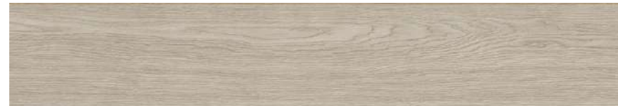
Porcelánico rectificado gran formato madera Berry